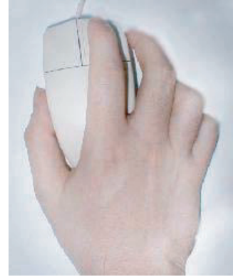
مُستعمل اليد اليمنى