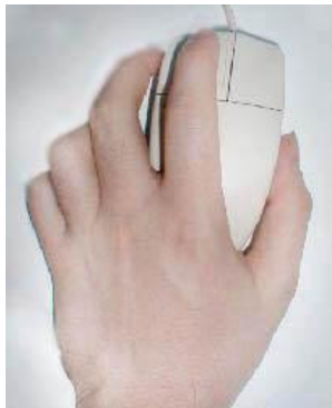
बायें हाथ का प्रयोग

माउस को अपनी हथेली में दाबें व हाथ की पहली अँगुली को बायें माउस बटन पर रखें।