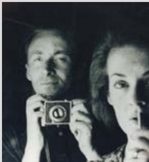
Albert TUCKER Στον καθρέπτη: αυτοπροσωπογραφία με τον Joy Hester 1939 συλλογή του Ιδρύματος Albert & Barbara Tucker, ευγενική προσφορά του Ιδρύματος

Ο Albert Tucker (1914-1999) ήταν ένας από τους πιο γνωστούς και αναγνωρισμένους καλλιτέχνες της Αυστραλίας, και ένας βασικός εκπρόσωπος του αυστραλιανού μοντερνισμού. Η έκθεση Tucker Portraits διερευνά πώς ο Tucker χρησιμοποίησε τη φωτογραφία ως πηγή της τεχνοτροπίας του, καθώς δημιουργούσε μοναδικά και οικεία πορτρέτα που διερευνούσαν την κοινωνική, πολιτιστική και πολιτική ζωή στην Αυστραλία.